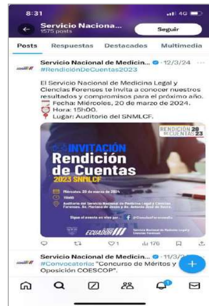
Ilustración 6: Publicación Red social X

El 20 de marzo de 2024, a partir de las 15:00 se realizó el acto público de Rendición de Cuentas para el período 2023, en el Auditorio de la Institución, paralelamente se hizo la transmisión en vivo a través de “Facebook Live”.