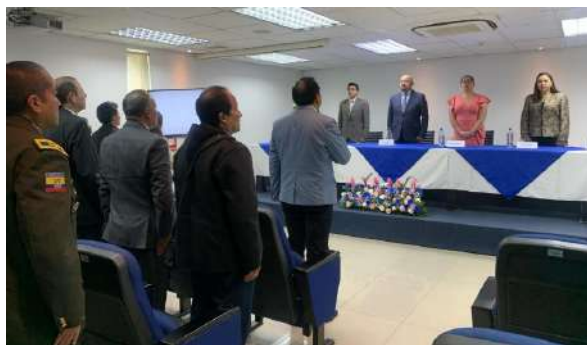
Ilustración 7: Rendición de Cuentas 2023

El 20 de marzo de 2024, a partir de las 15:00 se realizó el acto público de Rendición de Cuentas para el período 2023, en el Auditorio de la Institución, paralelamente se hizo la transmisión en vivo a través de “Facebook Live”.