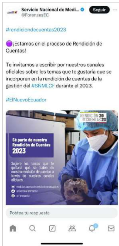
Ilustración 2: Publicación Red social X