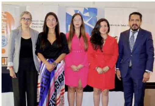
Capacitación sobre herramientas periciales para la valoración médica en casos de violencia física y sexual en género

Se realizó la capacitación al personal de Salud de primera acogida, “Capacitación sobre herramientas periciales para la valoración médica en casos de violencia física y sexual en género, dirigido al personal de Salud de primera acogida del Ministerio de Salud Pública del Ecuador” , en la cual participaron 15 médicos de salas de primera acogida. La capacitación se realizó los días 20 y 21 de julio de 2023 en Quito, con la participación del SNMLCF y de la Fiscalía General del Estado, en calidad de docentes y organizadores.