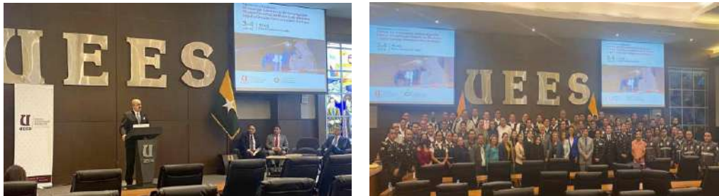
Socialización presencial del Manual del Subsistema de Investigación Técnico Científica en materia de Medicina Legal y Ciencias Forenses sobre peritajes que se llevan a cabo a nivel nacional – Guayaquil

El SNMLCF en coordinación con el equipo consular de la Embajada Británica y el apoyo de Policía Nacional del Ecuador llevaron a cabo el taller "Inducción del manejo técnico de cadáveres- versión tratamiento de cadáveres extranjeros", con el fin de garantizar un proceso eficiente en caso de personas extranjeras fallecidas en el país en estricto respeto a la dignidad humana.