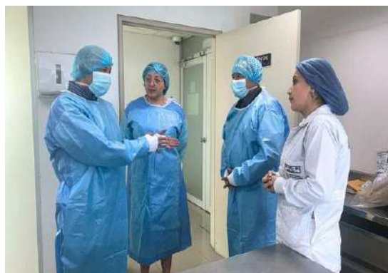
Visita autoridades del SNAI

Una vez que se aprobó el “Instructivo para la implementación de la base de datos de perfiles genéticos con fines de investigación forense y fines humanitarios de identificación de personas”, se elaboró la hoja de ruta para el inicio del plan piloto, dentro de estas acciones, se han mantenido acercamientos con las máximas autoridades y delegados del Servicio Nacional de Atención Integral a Personas Adultas Privadas de la Libertad y a Adolescentes Infractores (SNAI), Ministerio de Salud Pública del Ecuador (MSP) para determinar la hoja de ruta del proceso (octubre 2023), así como coordinar la ejecución del plan de capacitaciones a los Servidores del Cuerpo de Seguridad y Vigilancia Penitenciaria y a los médicos delegados del MSP.