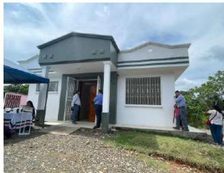
Estructura externa de la Morgue de Shushufindi

Con fecha 27 de noviembre de 2023, se realizó una reunión con las autoridades del GAD Shushufindi, para conocer el espacio físico donde existe una infraestructura destinada a la morgue del cantón, la misma que se encuentra dentro del cementerio del cantón Shushufindi.