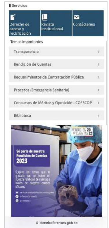
Ilustración 3: Publicación página web

De manera adicional a las interacciones que podrían presentarse mediante las redes sociales institucionales, se creó la cuenta de correo electrónico: rendición.cuentas@cienciasforenses.gob.ec , misma que fue difundida mediante las publicaciones mencionadas anteriormente con la finalidad de receptor los aportes que pudiesen presentarse.