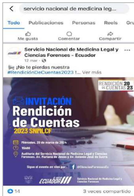
Ilustración 5: Publicación Red Facebook