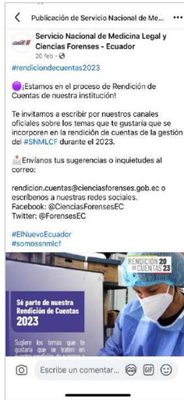
Ilustración 2: Publicación Red social Facebook