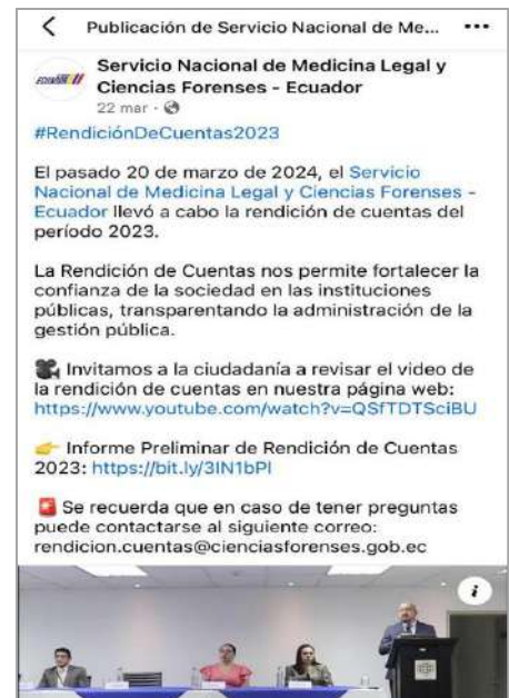
Ilustración 10: Publicación red social Facebook

A continuación, se presentan los aportes presentados por la ciudadanía en el proceso de Rendición de Cuentas del año 2023; así como la información proporcionada por las diferentes áreas institucionales en el marco de dar atención a los aportes referidos: