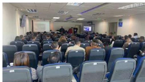
Capacitación "Manual del Subsistema de Investigación Técnico Científica en materia de Medicina Legal y Ciencias Forenses sobre peritajes que se llevan a cabo a nivel nacional".