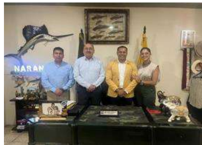
Visita a GAD Naranjal

Durante el primer trimestre 2023, se visitó el cantón Naranjal donde se pudo constatar el espacio físico con el que cuenta el Municipio para realizar el acompañamiento técnico de lo que podría ser la Unidad de Patología en esa ciudad.