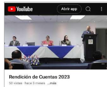
Ilustración 8: transmisión de Rendición de Cuentas 2023

Durante el evento deliberativo realizado en forma presencial y transmitido en vivo el día miércoles 20 de marzo de 2024, se receptaron aportes emitidos por la ciudadanía, los mismos que se señalan a continuación. Adicionalmente, se invitó a la ciudadanía a través de la página web institucional y redes sociales a visualizar el evento de Rendición de Cuentas 2023, revisar el informe preliminar de Rendición de Cuentas 2023, y en el caso que se requiera enviar aportes ciudadanos a la dirección de correo electrónico: rendicion.cuentas@cienciasforenses.gob.ec , conforme se muestra en las siguientes ilustraciones: