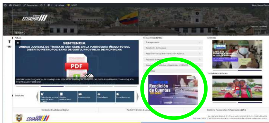
Ilustración 3: Publicación página web institucional

Como parte de la fase deliberativa del Proceso de rendición de cuentas, el Servicio Nacional de Medicina Legal y Ciencias Forenses, con fecha 12 de marzo de 2024, realiza la convocatoria a través de medios digitales (página web institucional y redes sociales en las aplicaciones Facebook y Twitter), invitando a la ciudadanía a asistir al acto público de Rendición de Cuentas 2023 que se realizó el 20 de marzo de 2024 en el auditorio institucional del Servicio Nacional de Medicina Legal y Ciencias Forenses.