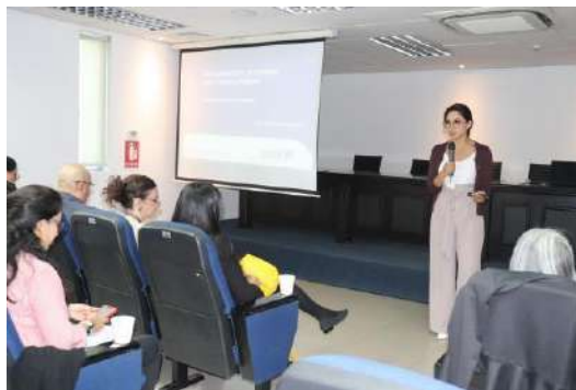
Inducción del manejo técnico de cadáveres- versión tratamiento de cadáveres extranjeros

El SNMLCF en coordinación con el equipo consular de la Embajada Británica y el apoyo de Policía Nacional del Ecuador llevaron a cabo el taller "Inducción del manejo técnico de cadáveres- versión tratamiento de cadáveres extranjeros", con el fin de garantizar un proceso eficiente en caso de personas extranjeras fallecidas en el país en estricto respeto a la dignidad humana.