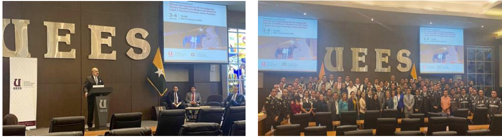
Socialización presencial del Manual del Subsistema de Investigación Técnico Científica en materia de Medicina Legal y Ciencias Forenses sobre peritajes que se llevan a cabo a nivel nacional – Guayaquil

El SNMLCF en coordinación con el equipo consular de la Embajada Británica y el apoyo de Policía Nacional del Ecuador llevaron a cabo el taller "Inducción del manejo técnico de cadáveres- versión tratamiento de cadáveres extranjeros", con el fin de garantizar un proceso eficiente en caso de personas extranjeras fallecidas en el país en estricto respeto a la dignidad humana.