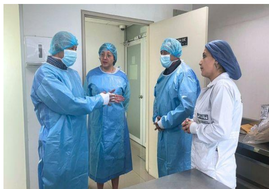
Visita autoridades del SNAI

Una vez que se aprobó el “Instructivo para la implementación de la base de datos de perfiles genéticos con fines de investigación forense y fines humanitarios de identificación de personas”, se elaboró la hoja de ruta para el inicio del plan piloto, dentro de estas acciones, se han mantenido acercamientos con las máximas autoridades y delegados del Servicio Nacional de Atención Integral a Personas Adultas Privadas de la Libertad y a Adolescentes Infractores (SNAI), Ministerio de Salud Pública del Ecuador (MSP) para determinar la hoja de ruta del proceso (octubre 2023), así como coordinar la ejecución del plan de capacitaciones a los Servidores del Cuerpo de Seguridad y Vigilancia Penitenciaria y a los médicos delegados del MSP.