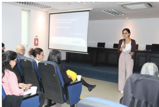
Inducción del manejo técnico de cadáveres- versión tratamiento de cadáveres extranjeros

El SNMLCF en coordinación con el equipo consular de la Embajada Británica y el apoyo de Policía Nacional del Ecuador llevaron a cabo el taller "Inducción del manejo técnico de cadáveres- versión tratamiento de cadáveres extranjeros", con el fin de garantizar un proceso eficiente en caso de personas extranjeras fallecidas en el país en estricto respeto a la dignidad humana.