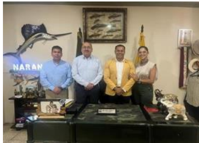
Visita a GAD Naranjal

Durante el primer trimestre 2023, se visitó el cantón Naranjal donde se pudo constatar el espacio físico con el que cuenta el Municipio para realizar el acompañamiento técnico de lo que podría ser la Unidad de Patología en esa ciudad.