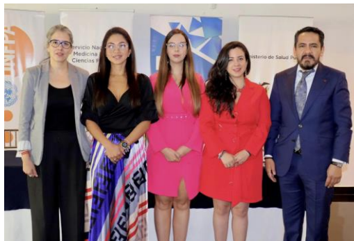
Capacitación sobre herramientas periciales para la valoración médica en casos de violencia física y sexual en género

Se realizó la capacitación al personal de Salud de primera acogida, “Capacitación sobre herramientas periciales para la valoración médica en casos de violencia física y sexual en género, dirigido al personal de Salud de primera acogida del Ministerio de Salud Pública del Ecuador” , en la cual participaron 15 médicos de salas de primera acogida. La capacitación se realizó los días 20 y 21 de julio de 2023 en Quito, con la participación del SNMLCF y de la Fiscalía General del Estado, en calidad de docentes y organizadores.