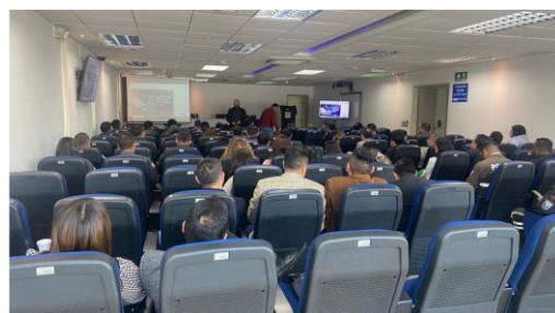
Capacitación "Manual del Subsistema de Investigación Técnico Científica en materia de Medicina Legal y Ciencias Forenses sobre peritajes que se llevan a cabo a nivel nacional".