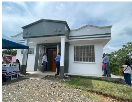
Estructura externa de la Morgue de Shushufindi

Con fecha 27 de noviembre de 2023, se realizó una reunión con las autoridades del GAD Shushufindi, para conocer el espacio físico donde existe una infraestructura destinada a la morgue del cantón, la misma que se encuentra dentro del cementerio del cantón Shushufindi.